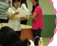
票選委員的開票過程