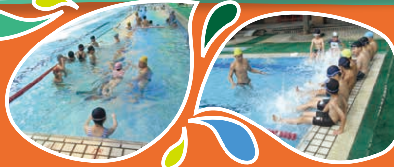
游泳教學-蹬牆漂浮

本校為無游泳池學校，申請新北市104年提升學生游泳與自救能力教學活動，與泳池業者合作於本學期進行高年級游泳教學活動，依學生個別差異，採分級分組能力教學，配合樂趣化與漸進式教學，引導學生親水、進而取水、愛水。