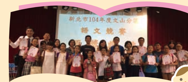
文山分區語文競賽團體總成績第一名

近年來，新北市教育局在小學五年級進行國語文、數學、英語能力檢測，其目的即為了解學生基本能力的概況，以透過教學精進策略，弭平學生國語文、數學和英語學習成就差距。孩子的學習成效取決於「教」與「學」，除了老師發展有趣的學習活動，提高學習動機外，如果孩子能按部就班、有效學習，相信青潭的孩子們一定能穩紮穩打，學力持續提昇。