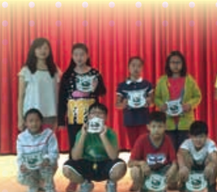
節能刮刮樂抽獎活動中獎學生