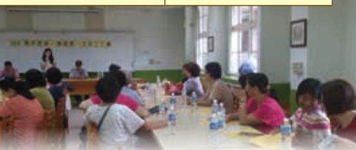
▲志工大會 ▼志工推選隊長