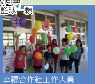
五年級同學換得50點籃球一顆 幸福合作社工作人員