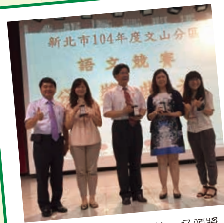
文山區團體總成績第一名頒獎