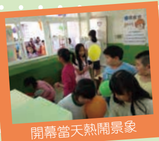
開幕當天熱鬧景象

幸福合作社開放時間是每週二下午下課及星期五上午下課。歡迎小朋友常常來逛逛，如果有任何意見，門口設置了意見箱，歡迎寫信告訴我們。