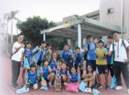
104文山分區六年級田徑對抗賽